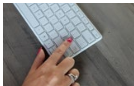
3 Ondernemingen en ondernemers