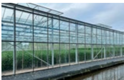
8 Verduurzaming en klimaat